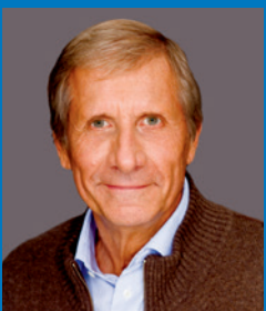
Ulrich Wickert Buchautor, Plan-Pate, Mitglied des Kuratoriums von Plan International Deutschland e. V.

„Die unabhängige und konfessionell nicht gebundene Organisation überzeugt mich durch ihre nachhaltigen Selbsthilfeprojekte, die nicht nur einem einzelnen Kind, sondern der ganzen Gemeinde zugutekommen. Daher unterstütze ich die Arbeit von Plan von ganzem Herzen.“