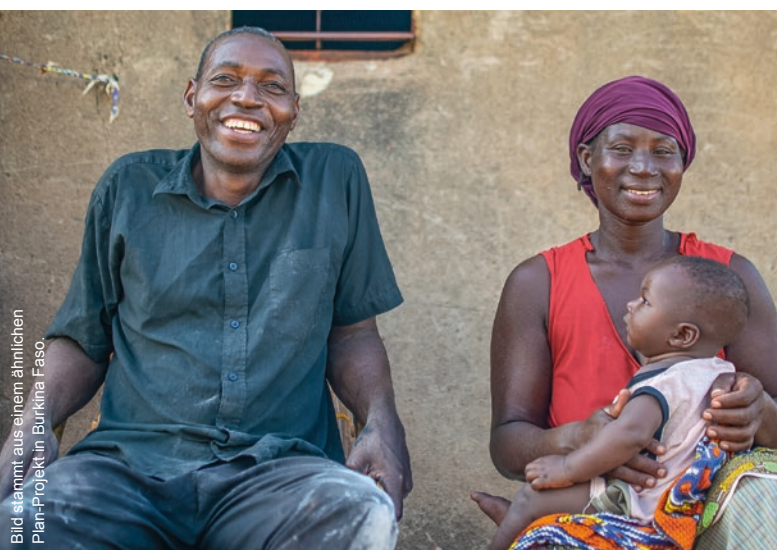
Bild stammt aus einem ähnlichen Plan-Projekt in Burkina Faso.

Um die Kompetenzen von Vätern und Müttern in frühkindlicher Förderung zu stärken, führen wir in 60 Projektgemeinden Schulungen zu positiver Elternschaft, früher Bildung und Kinderschutz durch. Zudem veranstalten wir Gemeindedialoge mit rund 1.800 Teilnehmer:innen. Auch hier geht es um aufmerksame und liebevolle Fürsorge, aktive Vaterschaft und positive Erziehung. Dabei werden unter anderem schädliche Normen und Praktiken besprochen, die sich negativ auf die Entwicklung von Kindern auswirken können. Ziel ist es, eine sichere und schützende familiäre Umgebung zu schaffen und positive Erziehungsmethoden zu fördern.