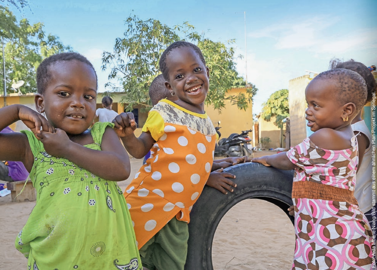
Foto: Aida Mbene Niang/Bild stammt aus einem ähnlichen Plan-Projekt im Senegal.

Spielen macht nicht nur Spaß, sondern fördert auch die motorischen und sozialen Fähigkeiten der Kinder