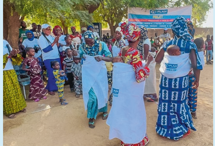
Junge Frauen tanzen während einer Projektveranstaltung

durchgeführt, um die Frauen und ihre Familien zu beraten und über Behandlungsmöglichkeiten aufzuklären. Die Hausbesuche und Betreuung der Frauen finden vertraulich statt. Wenn sie sich für eine medizinische Behandlung entscheiden, werden alle Umstände und Folgen der Behandlung sowie die Vorteile, die sie bieten, genau besprochen.