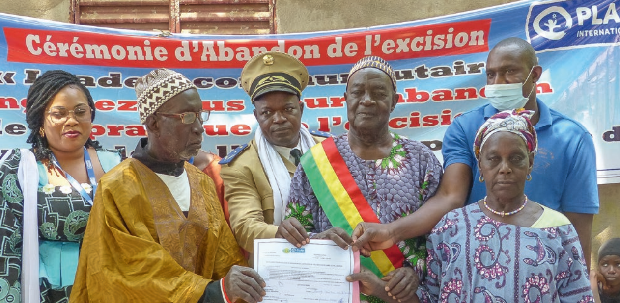
Eine Gemeinde erklärt offiziell die Abschaffung der weiblichen Genitalverstümmelung